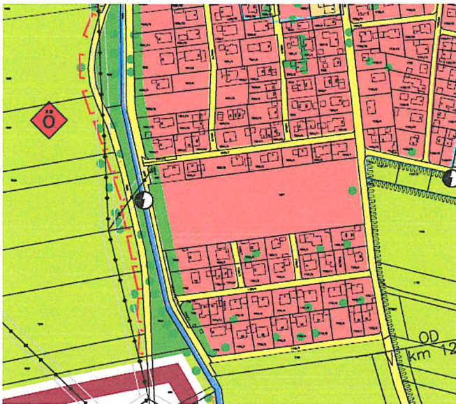
Ausschnitt aus dem rechtswirksamen Flächennutzungsplan, unmaßstäblich

Der geplante Geltungsbereich des Bebauungsplanes ist im rechtswirksamen Flächennutzungsplan bereits als Wohnbauflächen eingetragen.