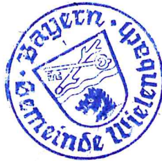
Harald Mansi Erster Bürgermeister