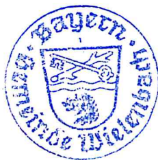
K. Steigenberger Erster Bürgermeister

Aushang angebracht am: 25.04.2019 Aushang abgenommen am: 25.05.2019